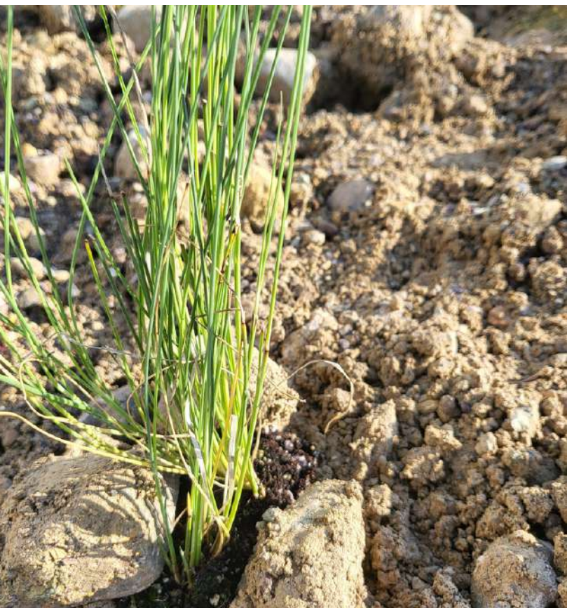
Cubierta vegetal Molina del Segura, 2022

El sistema Cikla es la única cubierta vegetal que utiliza las propias tierras de la parcela como sustrato , lo que la convierte en una cubierta vegetal más sostenible al generar menos residuos.