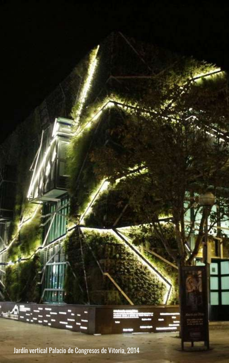
Jardín vertical Palacio de Congresos de Vitoria, 2014